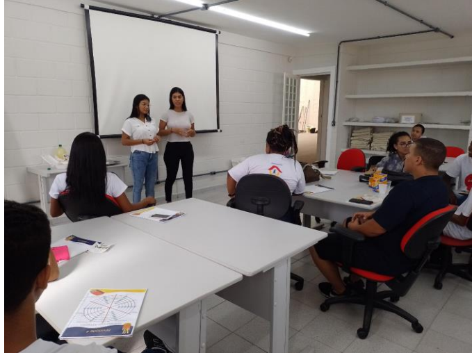
Durante Mentoria