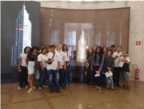
Foto: Atividade externa - Farol Santader